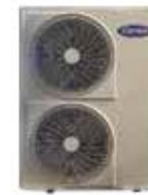
▲ 38RGT (048-060) Condensing Unit