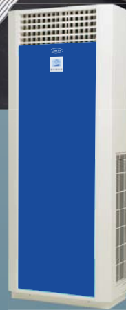
(Optional-Acrylic Front Panel)