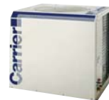
▲ 38LB SERIES Condensing Unit

1858/63-74, 14 th , 15 th Floor, Bangna-Trad Road, Km. 4.5, Bangna, Bangkok 10260 Thailand Tel. 0-2762-9222 Fax: 0-2751-4778